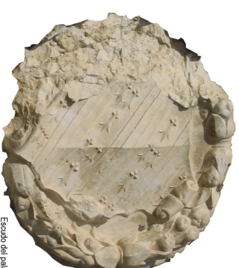
Escudo del palacio Jauregiaren armarra