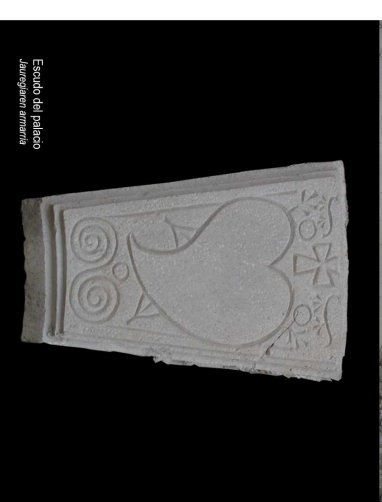
Escudo del palacio Jauraguren Armaria