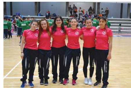
Burlatako Borroka Klubaren emakumezkoen taldea.

Borroka Olinpikoa ukipen-kirola da eta, oinarrian, borrokaldia irabazteko tapizaren barnean, arauak jarraituz, aukariaren gorputza heldu ( edozein motatako kolpeak guztiz debekatuta daude ) eta lurrera erortzea lortu behar da. Gero tapizaren gainean bere sorbaldak gelditu mantentzeko gai