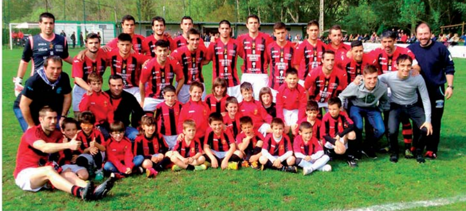
"FIESTA FIN DE CURSO" temporada 2015/2016 equipos: Primera Autonómica y Fútbol Txiki 6, 9 y 10/11 años

Todos los niños y niñas interesados con edades comprendidas entre los 5 y 10 años tienen toda la información en: