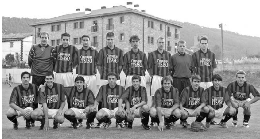
El equipo se presentó ante su afición en el I Trofeo Valle de Ezkabarte, el 25 de agosto.

Si bien esta escuadra representa la cara más conocida del Avance-Ezkabarte, el club no olvida la base. Es por eso que cuenta con un equipo de fútbol txiki para niños de entre seis a nueve años. Una decena de jóvenes promesas integran una plantilla que está abierta a nuevas incorporaciones.