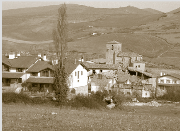
Azoz acoge este año la celebración del Día de Ezkabarte.

Por su parte, Zildoz celebra las fiestas los días 17, 18 y 19 de junio. La cena popular, los bailes y una fiesta infantil son algunas de las ofertas del programa