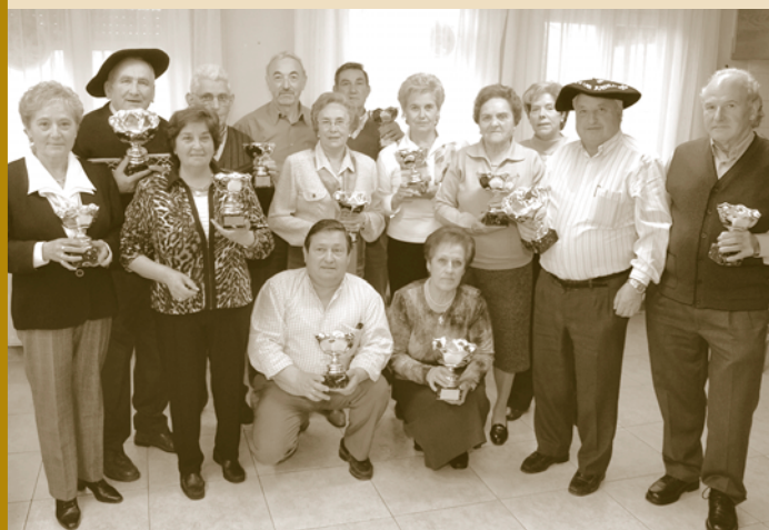
Las parejas premiadas posaron con sus galardones.

Makirriaingo kontzejua proposatuta, Ezkabarteko Udalak eta kontzejuz guztiek aldaketa bat eskatu diote Nafarroako Gobernuari politika linguistikoan. Bailarako errepideetako seinale guztiak elebizi jartzea eskatzen da, Ezkabarte "zonalde mistoan" kokatuta dagoela oroituz.