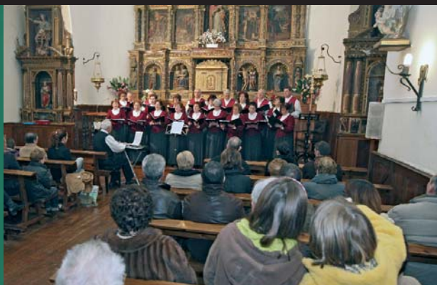
A la izquierda, grupo de danzas de Oberena, que abrió la programación de Navidad. Sobre estas líneas, actuación del Coro de Ezkabarte.